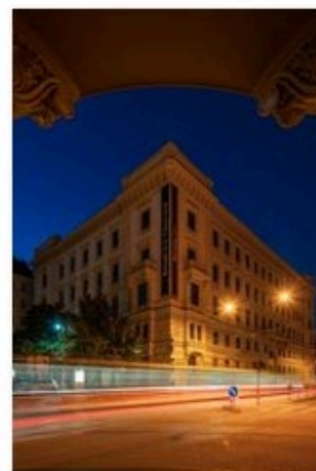
✔ mestsky dvur