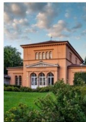
✔ pavilon luzanky