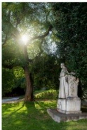
✔ pomnik mendela