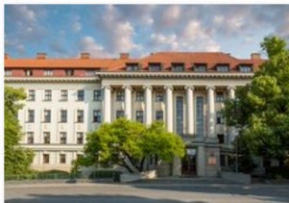
✔ mendelova_univ 1