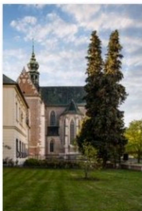
✔ augustinsky klaster 2